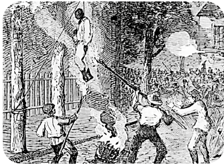
Figura 2. Escena de justicia primitiva, donde la venganza privada reflejaba la ausencia de normas penales estructuradas.

La historia señala que en los tiempos primitivos no existían reglas ni normas formales que regularan las conductas de los ciudadanos, y no había un conjunto estructurado de reglas que los habitantes de una comunidad debieran seguir. A diferencia de un derecho penal organizado, lo que existía eran prohibiciones basadas en conceptos religiosos propios de cada cultura, cuya violación traía consecuencias no solo para el infractor, sino también para su familia, clan o tribu. Cuando alguien era