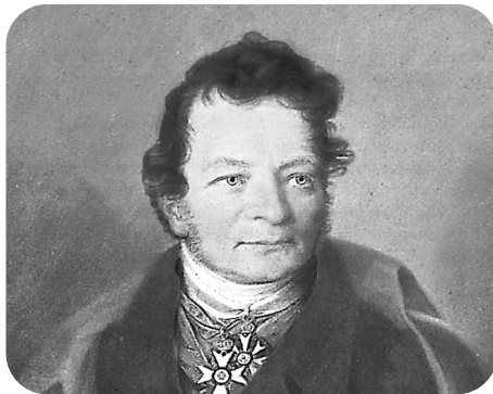
Figura 3. Anselm von Feuerbach (Alemania, 1829) es reconocido como uno de los autores que mejor conceptualizó lo que hoy conocemos como derecho penal.

Anselm von Feuerbach a partir de su enfoque preventivo-general, desarrolló el principio de legalidad, formulado en la famosa máxima: nullum crimen, nulla poena sine lege praevia (“ No hay delito ni pena sin ley previa ”). Este principio garantista, que se ha convertido en la base del derecho penal moderno, asegura que solo se puede castigar lo que está expresamente establecido en la ley, y ha sido objeto de estudio por todos los expertos en la materia (Von Feuerbach, 1829).