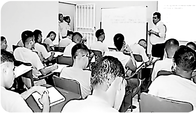
Figura 8. Taller educativo dentro de un centro de rehabilitación social en Ecuador, enfocado en la reinserción social y el desarrollo de capacidades de las personas privadas de libertad.

tección de las personas privadas de libertad y la garantía de sus derechos. El sistema tendrá como prioridad el desarrollo de las capacidades de las personas sentenciadas penalmente para ejercer sus derechos y cumplir sus responsabilidades al recuperar la libertad” (art. 201)