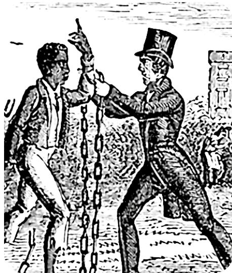
Figura 6. Representación del abolicionismo penal, simbolizando la lucha contra la opresión y el cuestionamiento de sistemas punitivos inhumanos, promoviendo la justicia y la equidad social.