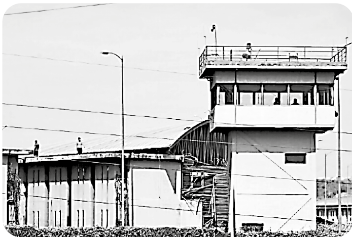
Figura 7. Vista de una prisión moderna en Ecuador, destacando su estructura organizada y los espacios de reclusión, representativa de los centros penitenciarios bajo observación internacional por su situación actual.