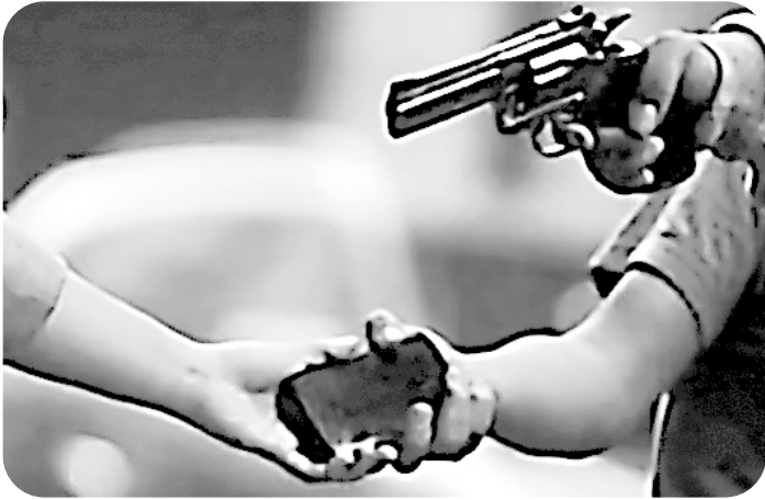
Figura 9. Representación del impacto de los delitos en las víctimas, destacando el contraste entre el interés por el criminal y el desinterés social hacia quienes sufren las consecuencias directas de la violencia.