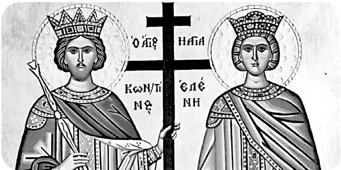
Figura 5. Representación del Derecho Canónico, reflejando su influencia en los delitos religiosos y su juzgamiento por tribunales eclesiásticos durante la Edad Media.

El derecho canónico recopila las normas y derechos de la Iglesia Católica desde la Edad Media, y llegó a tener influencia significativa en el ordenamiento penal de los países católicos. La legislación canónica se manifiesta en dos grandes aspectos: en primer lugar, en los delitos contra la religión, cuyo juzgamiento estaba sometido a tribunales eclesiásticos, como la Inquisición.