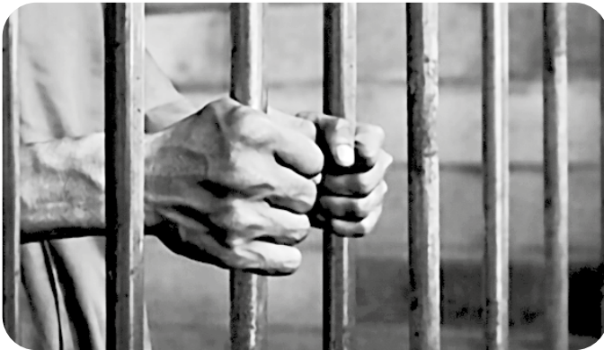
Figura 10. Detención

Hablar de la detención con fines investigativos y la prisión preventiva constituye una de las medidas más relevantes del proceso penal, siendo “la cereza puesta al pastel”. En su aplicación, existen criterios divididos entre abogados, jueces y fiscales. No existe una fórmula matemática que nos permita a todos coincidir en un mismo criterio, a pesar de que los requisitos es-