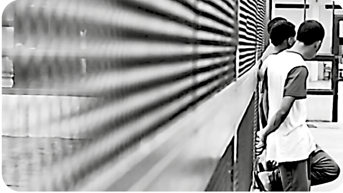
Figura 11. Adolescentes privados de libertad en un centro de detención juvenil, reflejando la necesidad de reformas en el sistema penal para abordar su reinserción social y prevenir su explotación por grupos criminales.

que los adolescentes puedan ser procesados a partir de los 14 años.